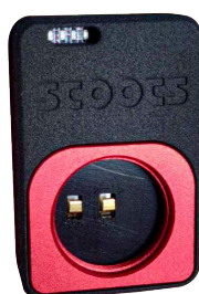
Notice chargeur easyLock 18